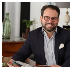
Mathieu PY GALERIE PY