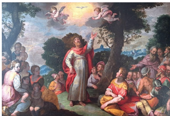
Simone BARABINO (Valpolcevera, Italie vers 1585 - vers 1620) La Prédication de Saint Paul, nd Huile sur toile, 124 x 172 cm

La suite s'annonce tout aussi stimulante, puisque, en juin dernier, l'un de mes projets vient de se concrétiser. Il s'agissait d'ouvrir une boutique dans la rue historique des antiquaires à Angers (49). A présent, une partie de mes œuvres sont visibles au 7 rue Toussaint ! Dans ma quête de nouveau et de développement, Un bureau verra probablement le jour à Paris, pour recevoir et montrer mes œuvres à la clientèle Parisienne.