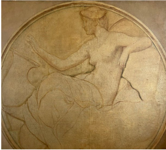
Pierre-Victor GALLAND (Genève 1822 - 1892 Paris) Allégorie du Commerce - esquisse non utilisée pour la galerie des Métiers de l'Hôtel de Ville de Paris, 1890 Huile, essence et crayon noir sur fond or sur toile. 119 x 115 cm - monogrammé 'PVG' en bas à gauche

Entre 1888 et 1892, Pierre-Victor GALLAND est chargé de décorer la galerie des Métiers de l'Hôtel de Ville de Paris. L'œuvre présentée a vraisemblablement été exécutée pour cette dernière. La redécouverte de l' Allégorie du Commerce complète un ensemble conservé au musée du Petit Palais et au musée de la Piscine.